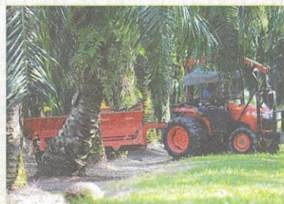
CIMB Securities says a two per cent Employees Provident Fund contribution for foreign workers will negatively affect planters' earnings per share by 0.4 per cent to 1.3 per cent.

"This will increase production costs unless worker productivity improves. We estimate that the potential impact of a two per cent EPF contribution for foreign workers to negatively affect earnings per share by 0.4 per cent to 1.3 per cent," it added.