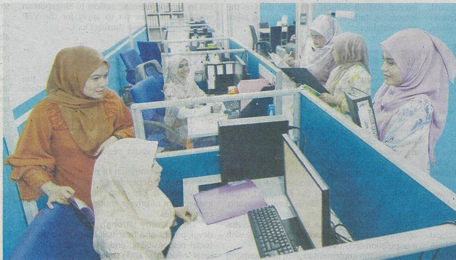
Yasir said human oversight remains essential to ensure that AI-driven content moderation systems function effectively and ethically.

He stressed that deploying AI in content moderation raises significant ethical concerns, including algorithms that may inherit or even amplify biases present in their training data, leading to discriminatory or inconsistent moderation.