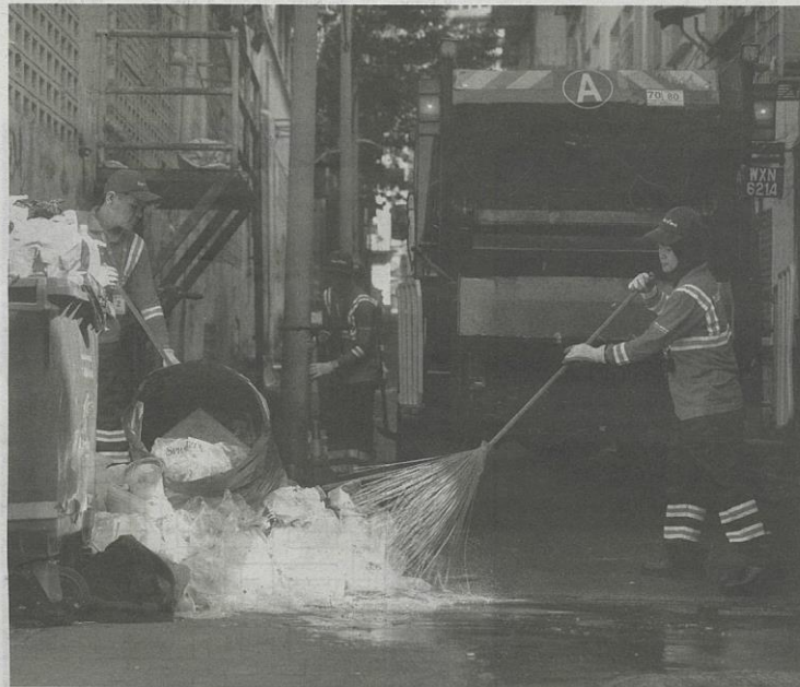
KENAIKAN gaji minimum sebanyak 13 peratus akan menyebabkan kos operasi kontraktor pembersihan meningkat 11 peratus.

Presiden Persatuan Pengurusan Pembersihan Malaysia (MACM)